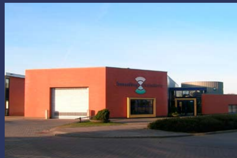
Foto Besseling Installatie